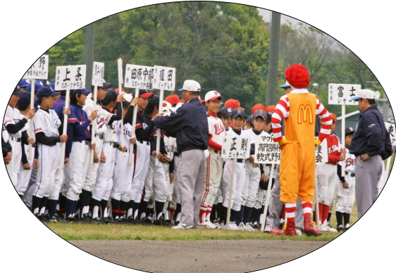
高円宮杯マクドナルドトーナメント出場