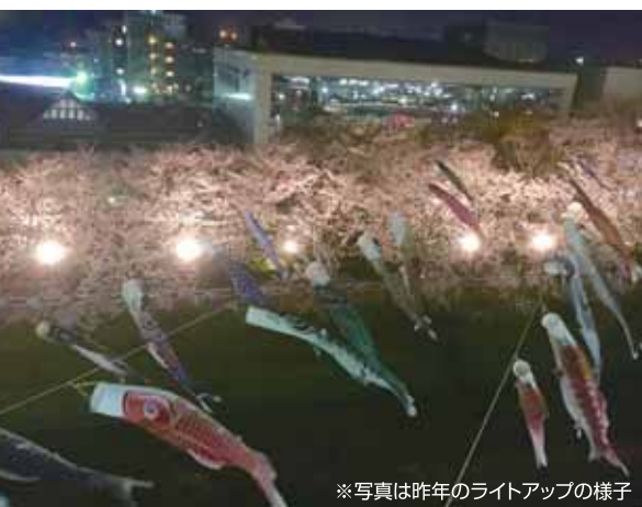
※写真は昨年のライトアップの様子