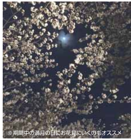
※期間中の満月の日にお花見に行くのもオススメ

アップも延長されることが決まりました。清谷橋からさくら橋を往復する約1km、ライトアップされた桜と暖かな日射しの中で見える桜、両方楽しんでみてはいかがでしょうか。